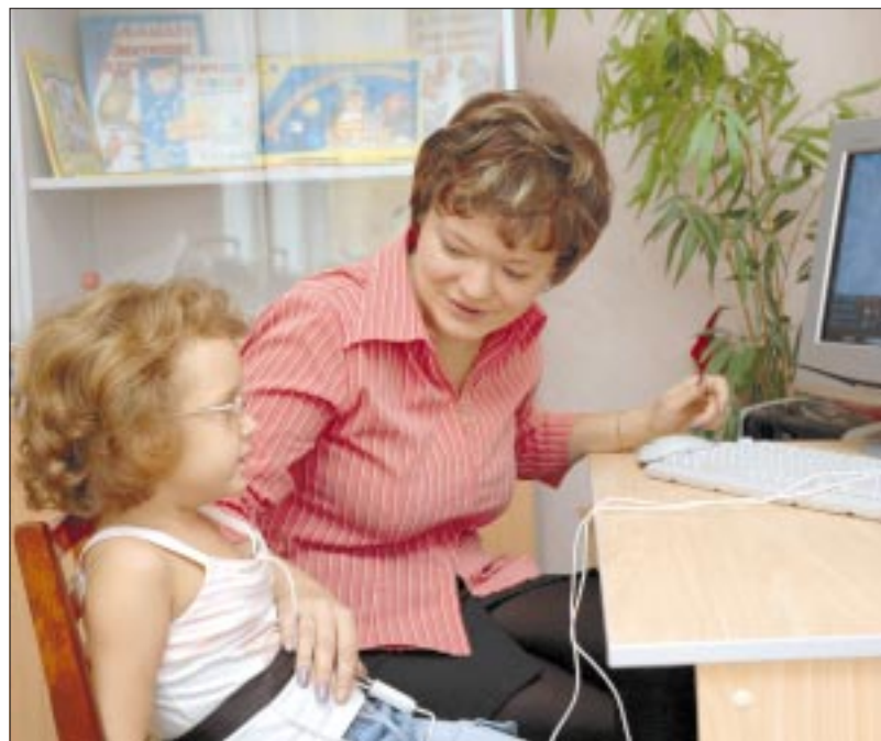
Занятия на аппарате БОС способствуют развитию и оздоровлению малышей