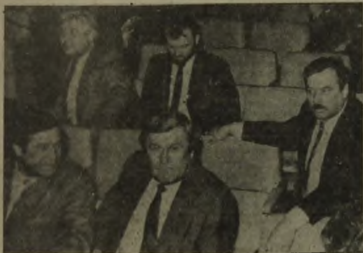
На снимках: депутатский корпус пытается решить городские проблемы