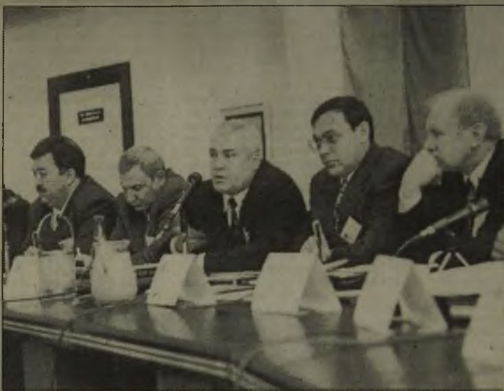
27 октября состоялось заседание Совета учредителей Фонда реконструкции и развития Нижневартовского района