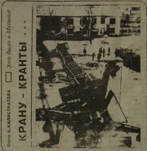
ЭТО БЫЛО В МЕГИОНЕ

Дни парада 24 октября - колли, афаны, эрдельтерьеры, 31 октября - пьюфаундлены, сенбернары, московская сторожевая, 7 ноября - кавказская овчарка, южнорусская овчарка. Мегионский клуб служебного собаководства.