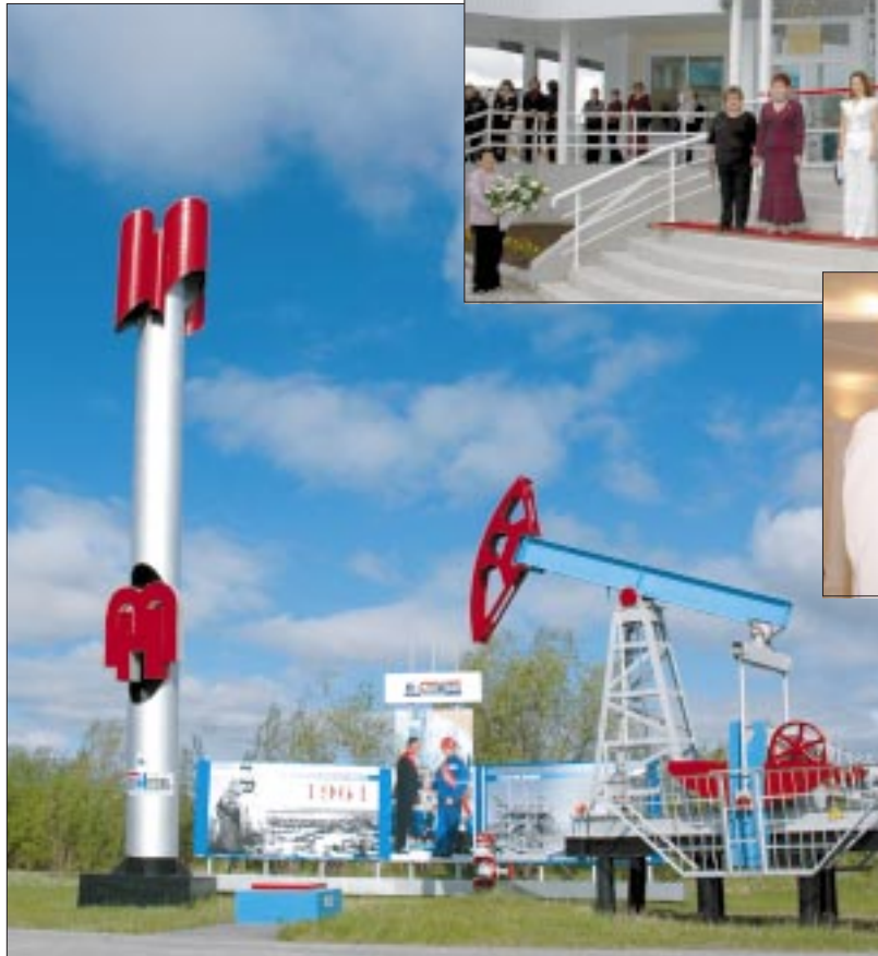
Также, как первая скважина мегионского месторождения положила начало разработке недр Среднего Приобья, так и первая тонна нефти, добытая мегионскими нефтяниками, стала точкой отсчета нового этапа развития Мегиона

производственные успехи послужили новым мощным импульсом для развития Мегиона. И, главное, глядя на то, как растут и развиваются дети, можно быть уверенным в том, что они превзойдут все наши достижения, а это значит, что будущее Мегиона в надежных руках.