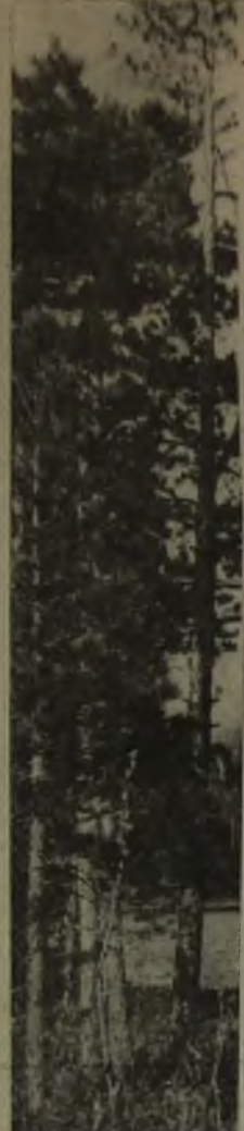
Мой Ангел был чист и светел. Я не видела его лица и не касалась перьев его крыльев, но меня согрело его дыхание. Каждый раз, когда летала во сне, я знала - это мой Ангел несет меня своим дыханием над миром, который я еще не знаю. Лишь однажды испугалась его прикосновения. Мне