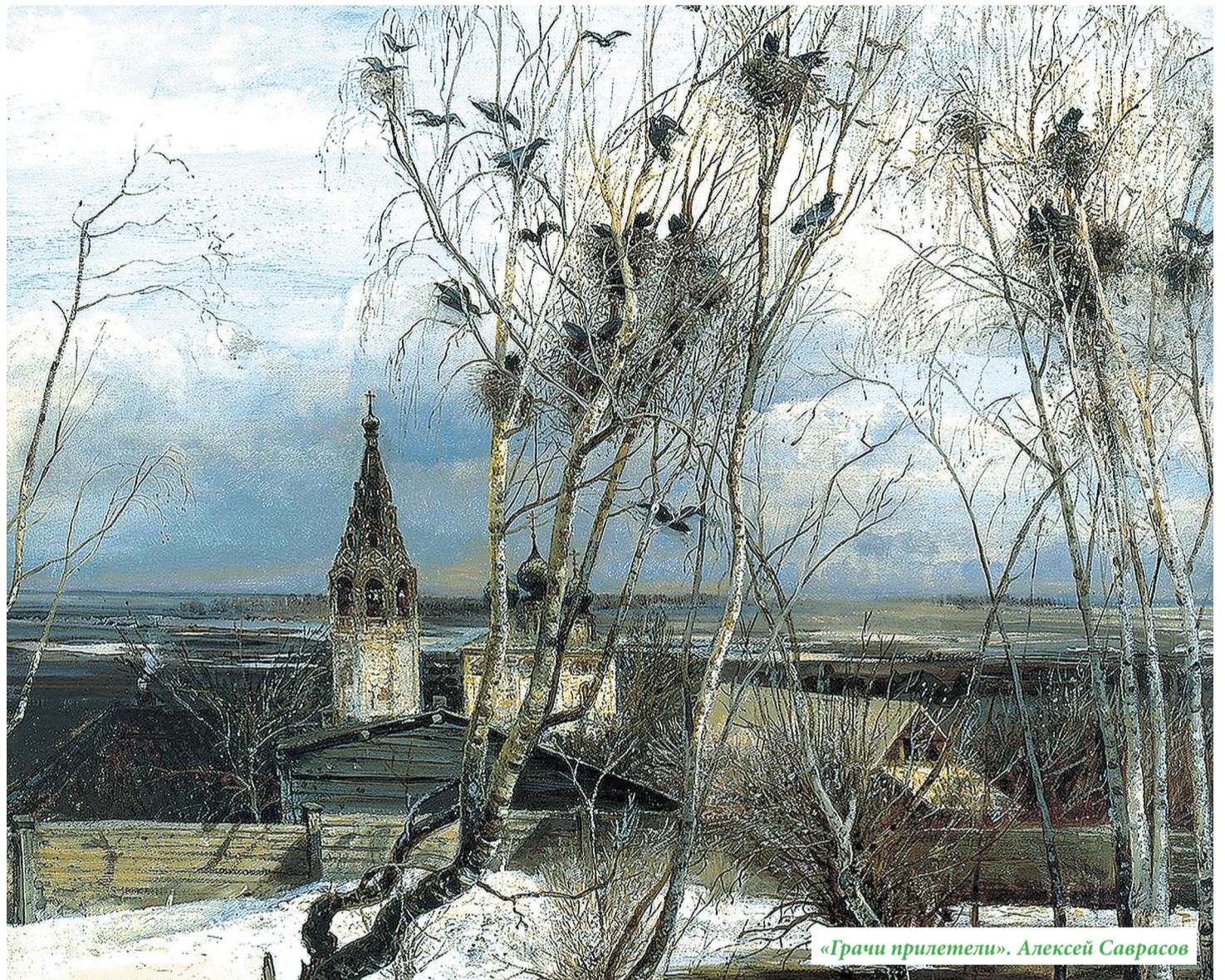
«Грачи прилетели». Алексей Саврасов