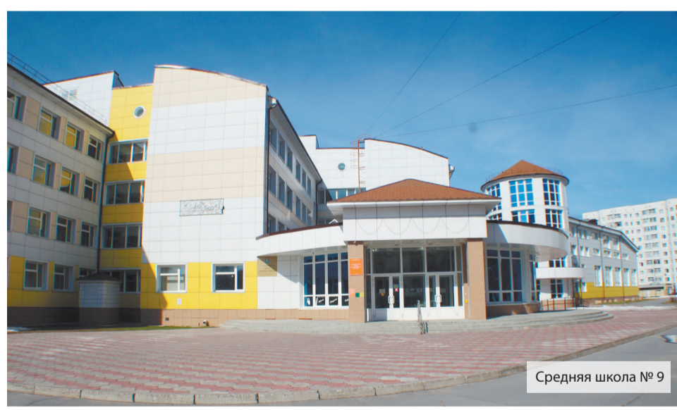
Средняя школа №9

Югра — динамично развивающийся субъект России, который стремится жить в завтрашнем дне. Для того чтобы планы стали реальностью и спортивная сфера в Мегионе была на передовой, следует принять общую концепцию развития физической культуры и спорта в городе. Когда мы сможем учитывать все возможные риски, когда перед нами