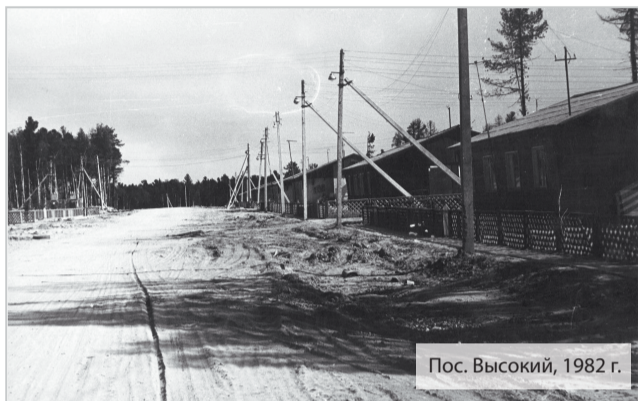
Пос. Высокий, 1982 г.