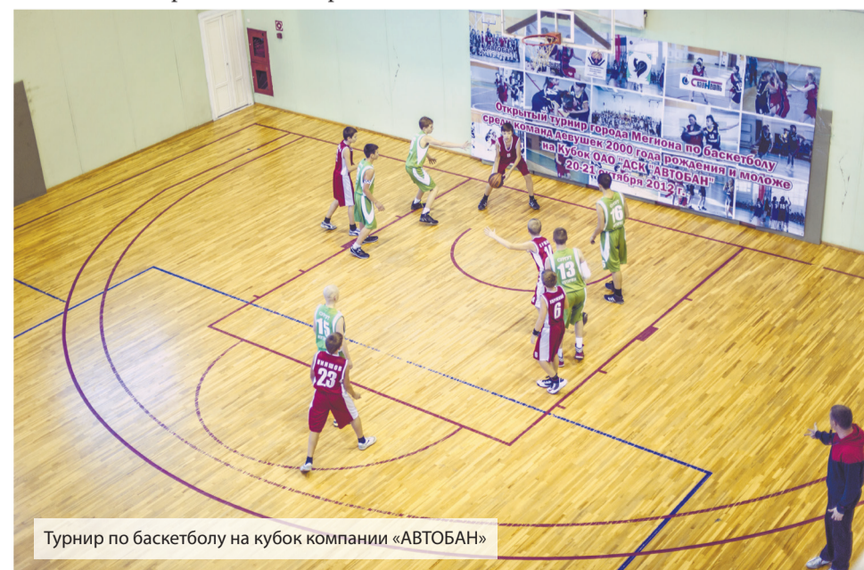
Турнир по баскетболу на кубок компании «АВТОБАН»

будет отражена реальная картина, будет легче идти вперед и достигать новых спортивных побед».