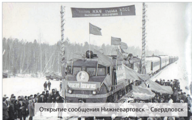
Открытие сообщения Нижневартовск – Свердловск