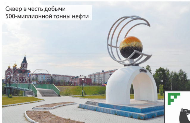
Сквер в честь добычи 500-миллионной тонны нефти

2009 — в рамках Международного молодежного фестиваля «Multi-2009» состоялся 1-й приезд делегации подростков из немецкого города Оберхаузен.