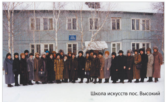
Школа искусств пос. Высокий