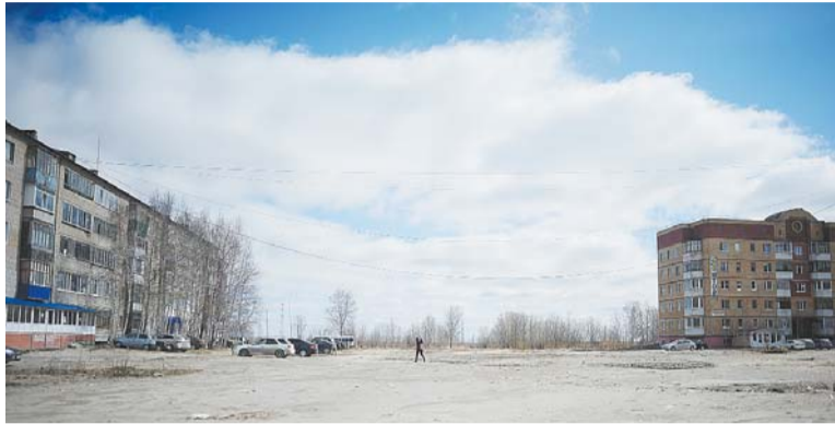
Так выглядит территория будущей Аллеи славы сегодня.

Общей сложности на воплощение этой задумки в жизнь потребуются около 38 миллионов, поэтому реализовывать ее будут поэтапно. Сейчас необходимо выполнить благоустройство участка, где расположит-