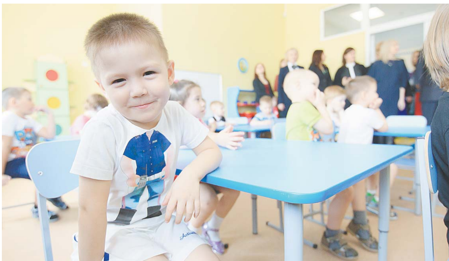
Пока работает только одна группа. Но в целом «Совенок» готов принять 260 ребятшек.

Обидно, когда кто-то называет Мегион «дефицитным», мол, многого нам не хватает. Друзья мои, созидатели города, ведь это не так! Своей энергией, активной позицией мы сами способны ликвидировать этот «дефицит». Тем более, что сегодня у нас есть все возможности не просто что-то сказать, но и быть услышанными. Говорите, если любите свой город! Да и как его можно не любить – искренне, преданно, всей душой, несмотря на короткое лето и суровую зиму. Такой город, как наш, незыблем. В таком городе можно и нужно творить, строить и наполнять его радостью. Создадим атмосферу комфорта и защищенности, превратим Мегион в такое место, которое никогда не захочется покидать. А покидая, снова и снова сюда возвращаться!