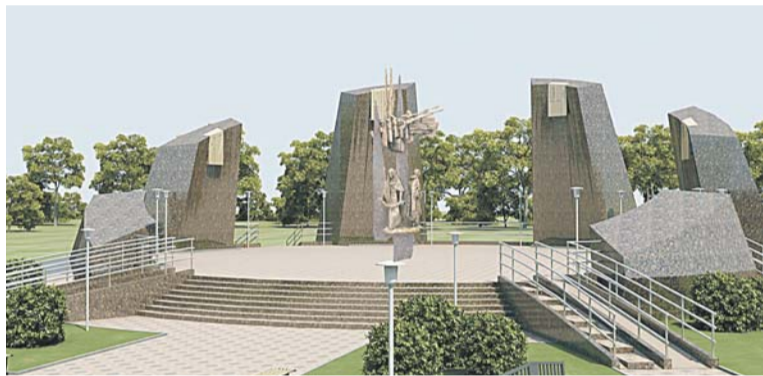
Проект мемориального комплекса, который появится на этом пустыре.

мориал «Аллея славы» задуман как полноценное место отдыха: с лавочками, аллеями и другими присущими любым парковым зонам элементами. Строительство позволит привести в порядок пустырь, где планируется возводить мемориал (между магазином «Шарм» и домом №12 по улице Сутормина) и прилегающие террито-