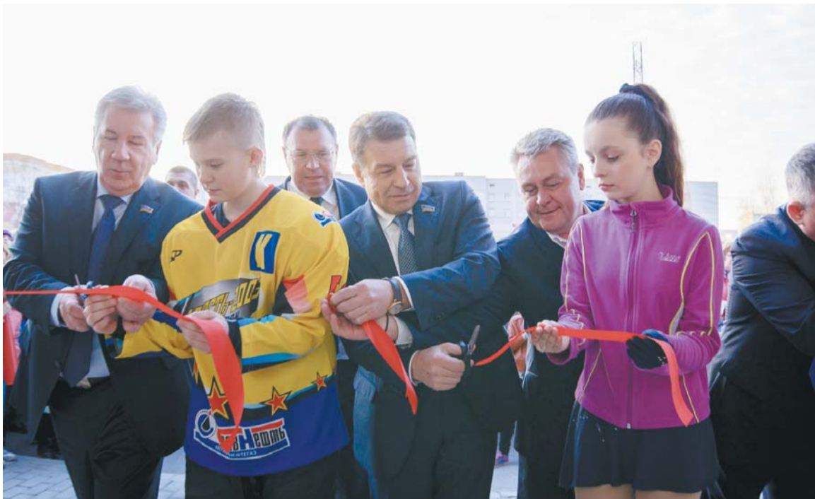
Сбылась еще одна мечта хоккеистов и их тренеров - теперь они могут тренироваться в родном городе и принимать на своей площадке соревнования уровня Первенства страны.

Но больше всего радуются событию мегиионцы, которые все это время пристально следили за ходом строительства спорткомплекса и с нетерпением ждали его открытия.