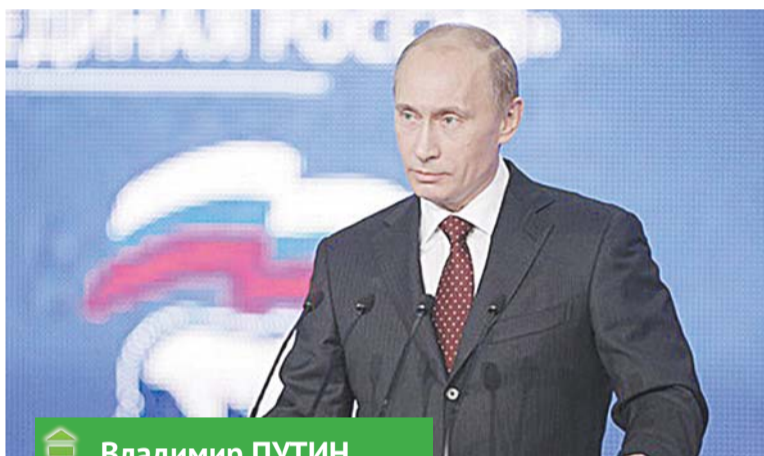
Владимир ПУТИН, Президент Российской Федерации:

Надо сказать, что для Югры предстоящие сентябрьские выборы впервые окажутся столь масштабными. Осенью нам предстоит выбрать депутатов, которые будут представлять наши интересы в Государственной Думе, областной, окружной и город-