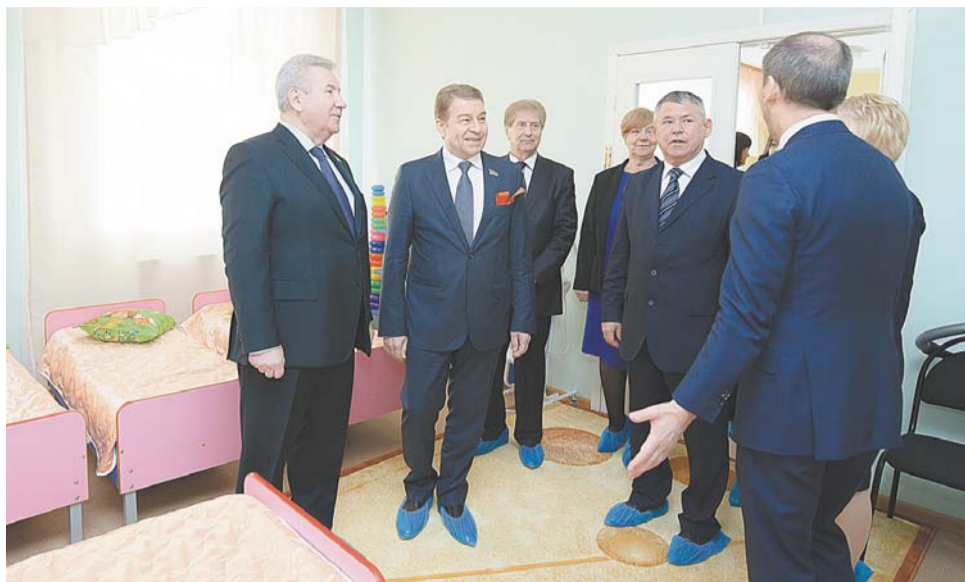
Во время экскурсии по саду гости лично убедились, что здесь созданы самые лучшие условия для маленьких мегионцев.

«Игровая и столовая зона у нас в одном помещении, а спальня – отдельно, все помещения просторные, - проводит она экскурсию для гостей. – Посмотрите, какие игрушки, как санузел оборудован, какая материальная база... Моим первым мегионским выпускникам уже по 42 года! Могут только представить, если бы у них, тогдашних карапузов, было то, что есть сегодня у наших ребятшек!».