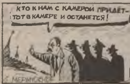
КТО К НАМ С КАМЕРОЙ ПРИДЕТ - ТОТ В КАМЕРЕ И ОСТАНЕТСЯ!