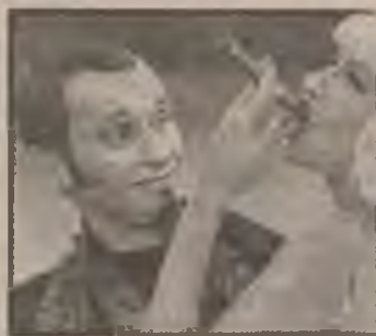
вода и дыхательных путей.

Почти полвека врачи всех стран мира ведут борьбу с курением. Предупреждает Минздрав, предупреждают аналогичные организации в Европе и Америке. Но, как в любой войне, боевые действия ведет и вторая сторона - табачные компании. Промышленные корпорации, производящие табачную продукцию, не сдаются, предпринимая «обходные маневры».