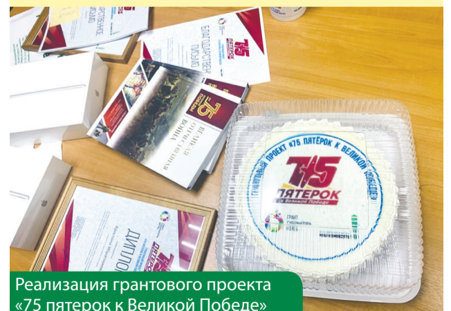
Реализация грантового проекта «75 пятерок к Великой Победе»

Цель: создавать условия для эффективного развития образования в Югре путем реализации, поддержки проектов и мероприятий в области образования.