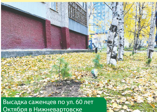
Высадка саженцев по ул. 60 лет Октября в Нижневартовске

Цель: повышать уровень благоустройства и озеленять города и поселки в Югре, создавать наиболее благоприятную и комфортную среду для горожан.