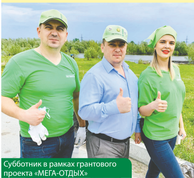
Субботник в рамках грантового проекта «МЕГА-ОТДЫХ»

Своей деятельностью фонд показывает, что повысить качество жизни в городе удастся, если мы объединим усилия, задействуем всех югорчан для решения местных проблем. Чтобы и далее способствовать позитивным изменениям в обществе, Фондом «МЫ ВМЕСТЕ» запланирована реализация уже традиционных программ.