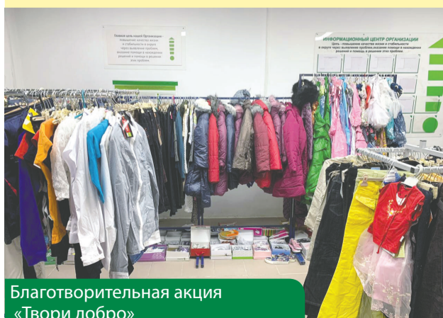
Благотворительная акция «Твори добро»

Цель: улучшать качество жизни и оказывать социальную поддержку гражданам, попавшим в трудную жизненную ситуацию.