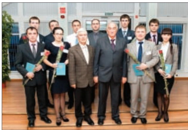
Новая группа специалистов ОАО «СН-МНГ» завершила обучение в РГУ нефти и газа им. И.М. Губкина. Все десять выпускников успешно защитили свои проекты и получили свидетельства об окончании курсов повышения квалификации