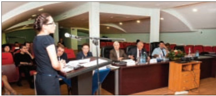
Свои проекты специалисты представили на суд приемной комиссии, в состав которой по традиции вошли руководители ОАО «СН-МНГ» и профессора РГУ нефти и газа им. И.М. Губкина

В ОАО «Славнефть-Мегионнефтегаз» подвели итоги обучения сотрудников в Российском государственном университете нефти и газа имени И.М. Губкина. Десять перспективных специалистов успешно защитили проекты, над которыми они работали в течение года. Приемная комиссия отметила актуальность предложений по повышению эффективности производственных процессов на предприятии и высокий уровень подготовки выпускников университетского курса.