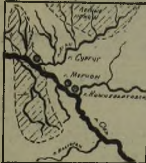
КАРТА - СХЕМА распространения археологических памятников