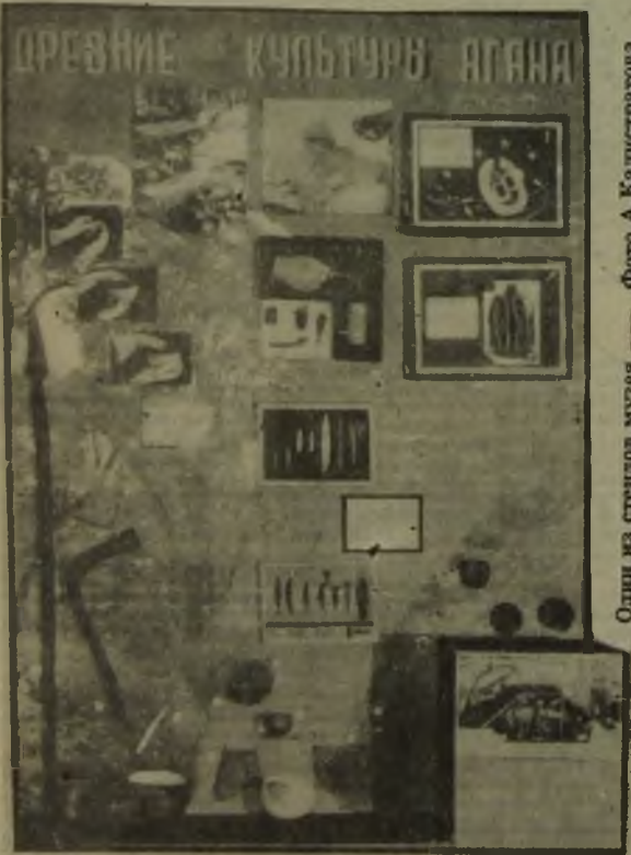
Один из стендов музея