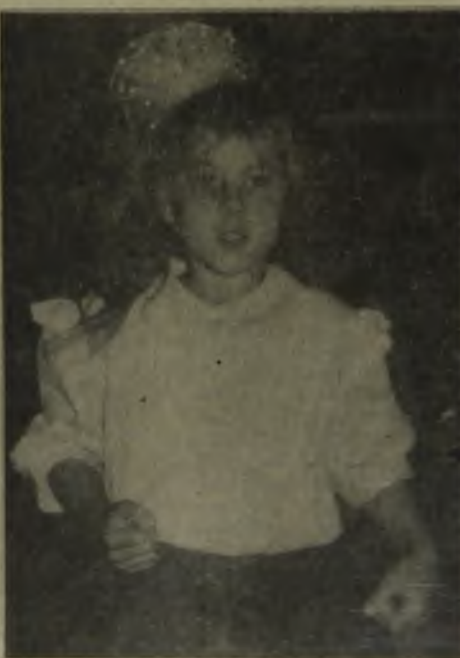
На занятиях в кружке современного танца

Каждому человеку хочется ощущать себя красивым и привлекательным. Одним из способов воплощения этого желания в жизнь является умение танцевать.