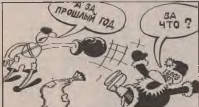
Рис. Р. ГАТАУЛЛИН.