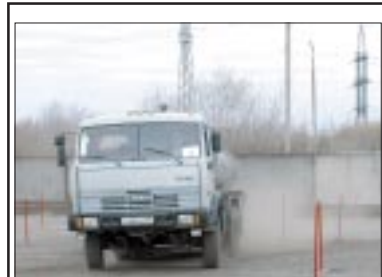
НА КРУТЫХ ВИРАЖАХ