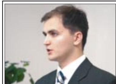
ТЕБЕ СЛОВО, МОЛОДЕЖЬ