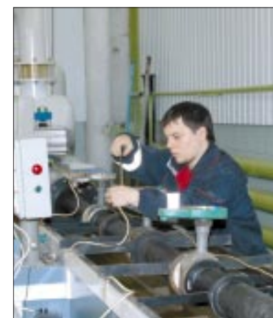
Использование современного оборудования обеспечивает требуемую точность измерений и испытаний

На сегодняшний день калибровку прошел весь комплекс используемых в ОАО «СН-МНГ» датчиков и приборов по учету добываемой из скважин жидкости. Использование современной проливной проверочной установки обеспечивает требуемую точность измерений и испыта-