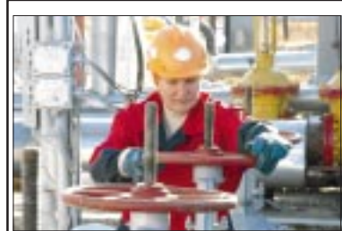
В ТЕМПЕ РАЗВИТИЯ ЛЕВОБЕРЕЖЬЯ