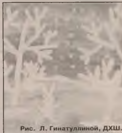
Рис. Л. Гинатуллиной, ДХШ.